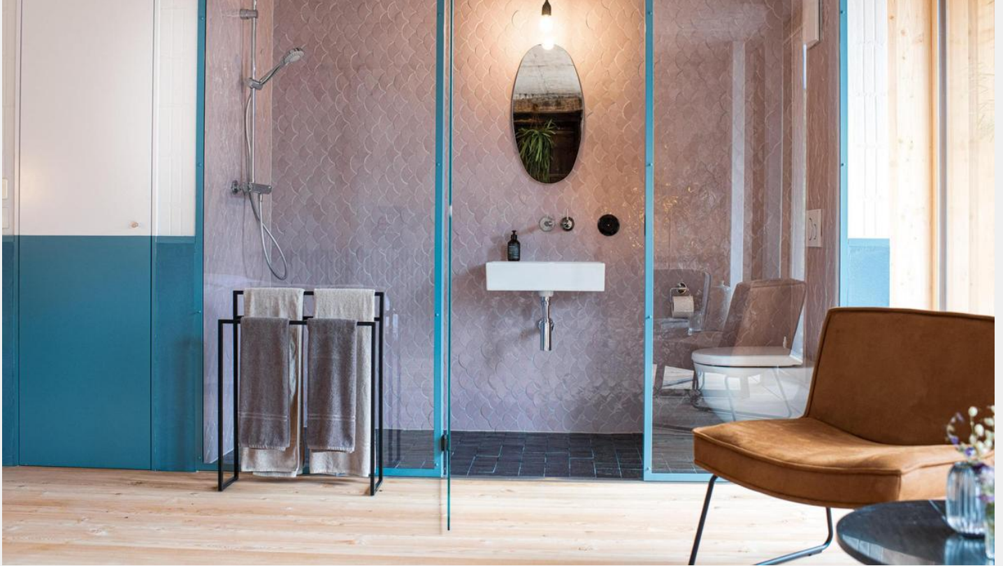
Tremondi Boutique BnB Ein kleines, schickes Bed & Breakfast, das in puncto Stil zu den Grossen gehört. Tremondi Boutique BnB

Die individuell gestalteten Zimmer tragen die Namen von Fischen – denn im BnB in Quinten ist man ganz nah beim Walensee und an der Natur. Nach langen Spaziergängen am See erwarten einen abends mediterrane Menüs. tre-mond.ch