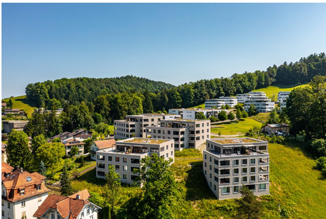
Die Wohnüberbauung Wattweg.ch in St. Gallen

Fortimo Invest hat die Eigentumswohnungen des Projekts Wattweg.ch nach gut zwei Jahren Bauzeit fertiggestellt. Die 41 Einheiten verteilen sich auf vier Gebäude. Nach Angaben von Fortimo waren alle Wohnungen bereits vor Bauvollendung verkauft.